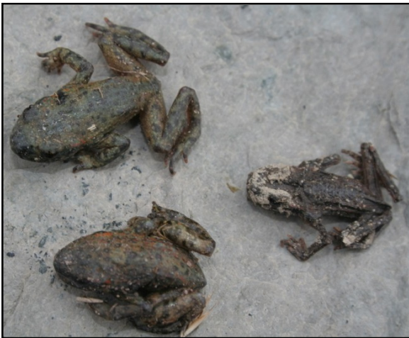
Vroedmeesterpadden, Alytes obstetricans , gestorven door chytridiomycosis.

Meest kenmerkend zijn het loslaten van stukjes huid (meestal ongeveer 14 dagen na blootstelling aan de schimmel), vervormde bekken bij kikkervissen en plotselinge sterfte zonder enige externe aanwijzing. Verdere symptomen zijn anorexie (8 dagen na blootstelling), sloomheid, gedragsverandering, abnormale houdingen, het niet meer corrigeren van een foute lichaamshouding, pupilverwijding, huidverkleuring (rood en op de rug grijzig), huidverdikking en huidwondjes.